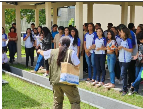
(b) Parte prática com a descrição do processo de medida de telhados.