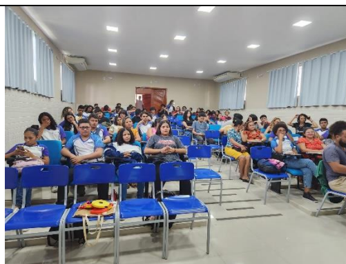
(d) Aula teórica com a explicação do conteúdo.