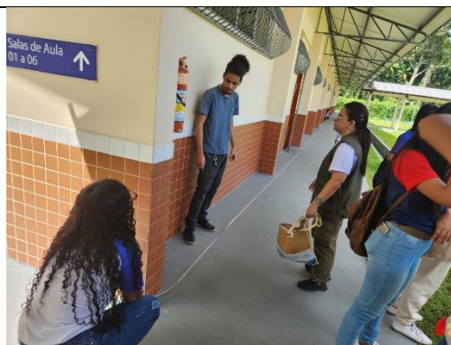
(c) Execução da parte prática do curso, com a medida da área útil de captação da água de chuva.